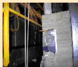
Pasta de Papel