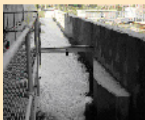
Tratamento de Água