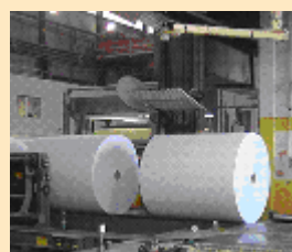
Rolos de Papel